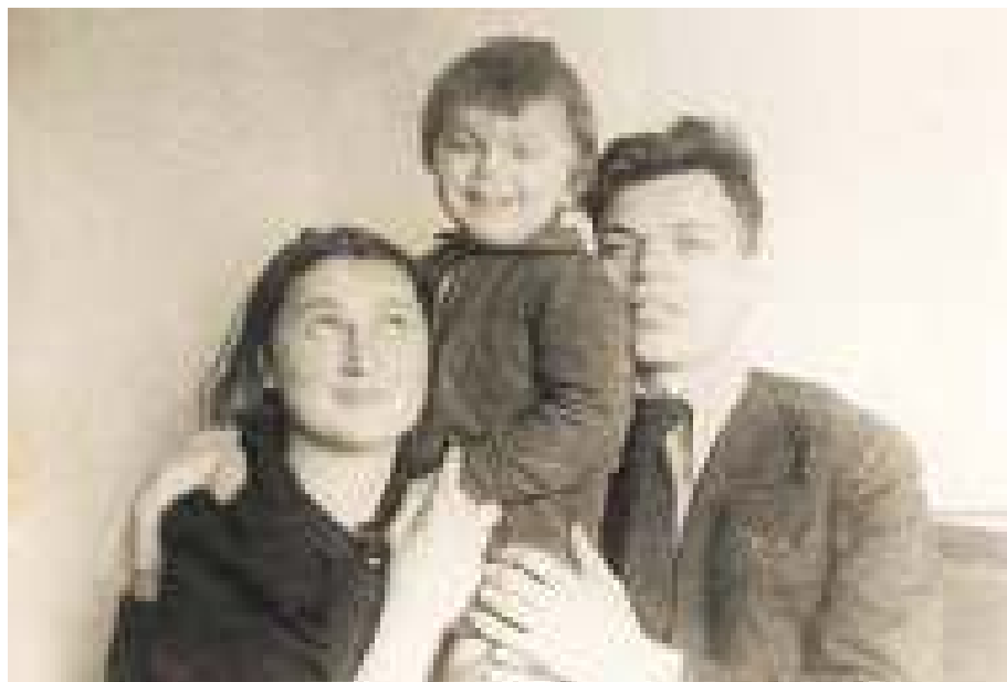
С родителями. 1940 год

ном в Тверской области. Отец увлекался живописью и поступил в Архитектурный институт. А мама моя была художницей по текстилю.