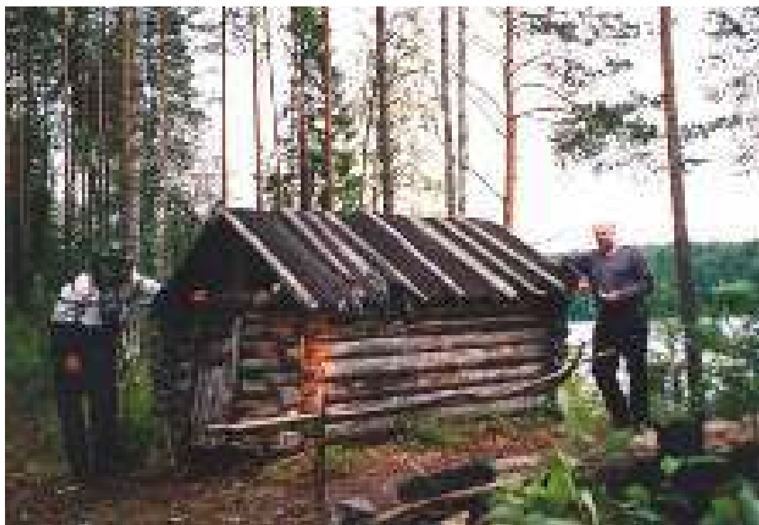
Избушка рыбаков в Кенозерье

Ландшафт — это хранилище множества пластов культуры. Он создается многими поколениями людей разных национальностей, живших в разные исторические эпохи. Все они оставили в нем свой след. Там сохраняется ассоциативная память о предшествующих временах. Этот ландшафт тесно связан с искусством. Я считаю, что многие культурные ландшафты возникли благодаря тому, что стали «героями» произведений искусства.