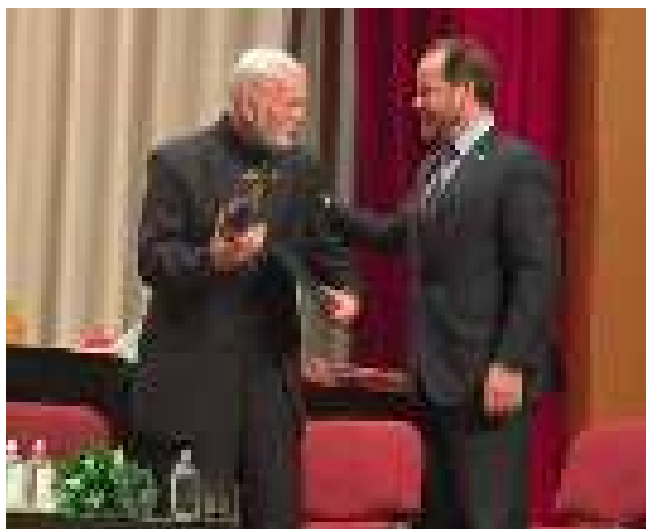
Вручение Премии имени Алексея Комеча. Апрель 2017 года

Концепция культурного ландшафта была нами использована и в Кенозерском парке. Сейчас там продолжается процесс создания системы музеев. Недавно, например, создан музей, посвященный фольклористам, которые работали в Кенозерье и впервые на Русском Севере начали делать записи