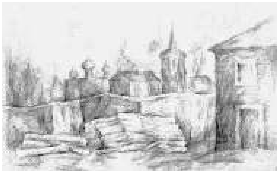
Ю. Веденин. Каргополь

В качестве примера можно привести литературный ландшафт. Это Мещерский край, созданный воображением К. Паустовского, свои ландшафты создали Пушкин, Толстой, Тургенев. Когда мы говорим о парковом ландшафте, то сразу вспоминаем об Андрее Болотове, авторе теории русского садово-паркового искусства. Если говорим о северном, поморском ландшафте, то возникают образы жителей Поморья, которые и обустроили этот ландшафт.