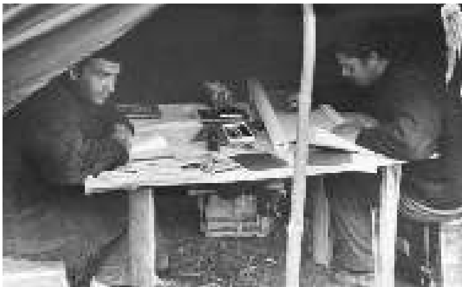
Во время экспедиции на Селигере. 1968 год

своих современников и тем более будущее поколение, если говорим, что «новодел» — это историческое здание.